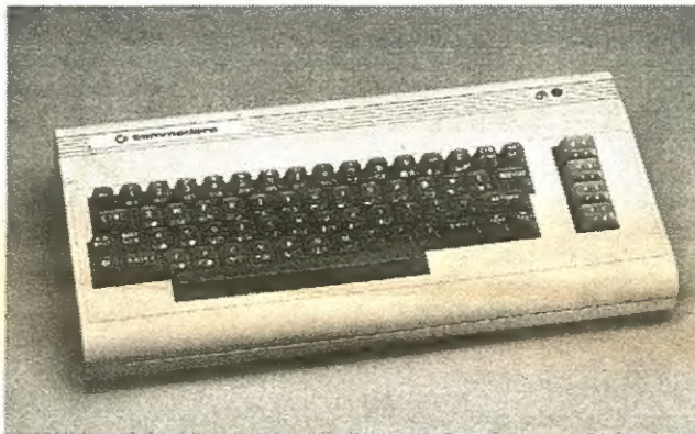
O Commodore 64, surgido em 1982, entrou na história como o computador pessoal do qual foram vendidos mais exemplares no mundo inteiro

Ainda em 1982, a ascensão do IBM PC e do MS-DOS viria a ser reforçada pelo anúncio do microprocessador 80286, da Intel, que iria dar origem ao IBM Personal Computer — Advanced Technology, ou seja ao PC-AT, mas um bom número de construtores preferiu o 68000 da Motorola, para oferecer características ainda melhores — um exemplo foi o da Fortune Systems com o seu modelo 32-16, enquanto outros apostavam nos sistemas de biprocessadores, como a Tandy-Radio Shack, com o seu TRS-80 Model 16, que dispunha de um Z80 (para correr os programas de CP/M) e de um 68000 — custava 4999 dólares, tinha 128 Kb de RAM e usava disquetes de oito polegadas. O mesmo acontecia com a Digital, a Commodore, a Vector Graphic, a North Star e a Heath/Zenith. Um erro de estratégia, porque os programas do CP/M, com o seu limite de 64 Kb, foram, bem depressa superados pelos do MS-DOS, que dispunham de um limite dez vezes maior, e porque, em contrapartida, ainda não havia — nem há — um sistema operativo tão universal como o MS-DOS e similares para os computadores